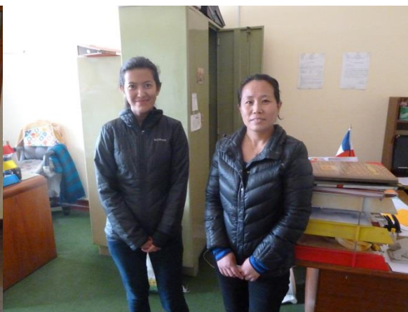
(Frau Dolma und Frau Yankey)