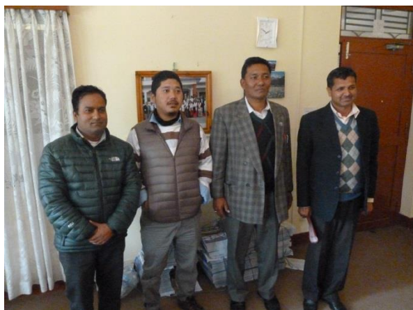
(Herren Bimal, Lama, Mahabhir und Govinda)