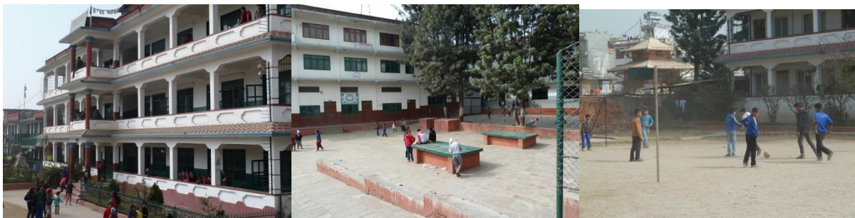
(Pausenszenen auf dem Schulhof)