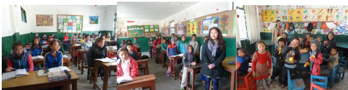
(Bilder aus den Schulzimmern)

Wie sich anlässlich unseres Besuches gezeigt hat, präsentiert sich die Schule in einem guten Zustand. Sämtliche Lehrer- und Administrativstellen sind besetzt. Der Unterricht läuft problemlos. Schulgelände, Schlaf- und Essenssäle sind bescheiden, aber gepflegt und sauber.