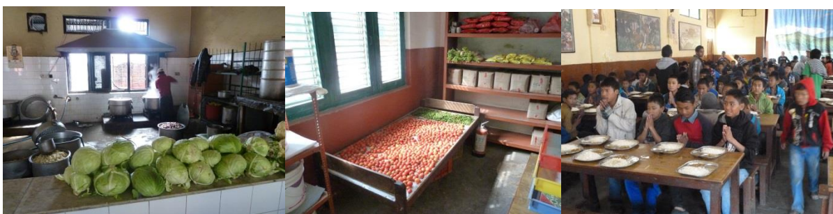
(Koch beim Zubereiten Mittagessen)